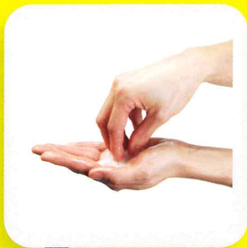
4 NETTOYER LES ONGLES