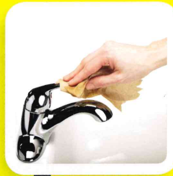
7 FERMER AVEC LE PAPIER